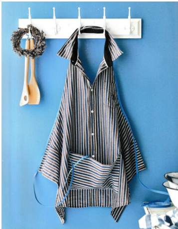
● UN TABLIER DANS UNE CHEMISE Schéma

COUTURE : Viviane et Martine vous proposent une production simplissime d' un tablier-chemise . Non seulement elle vous permet de faire œuvre utile, mais aussi de réutiliser une vieille chemise et donc de moins jeter !